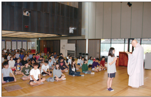
혜거 큰스님으로부터 인증서를 받는 수료생

지난 9월 6일(일) 오후 2시 탄허기념박물관 보광명전에서 청소년 기초참선반 수료식이 있었습니다.