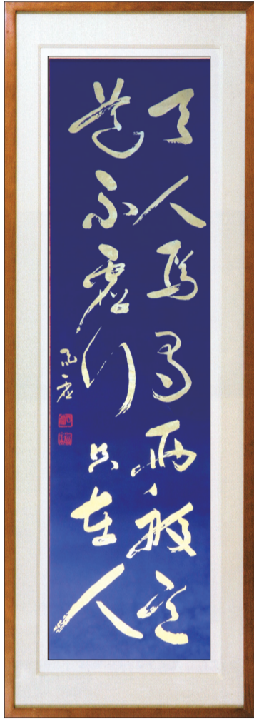
1280 x 300mm