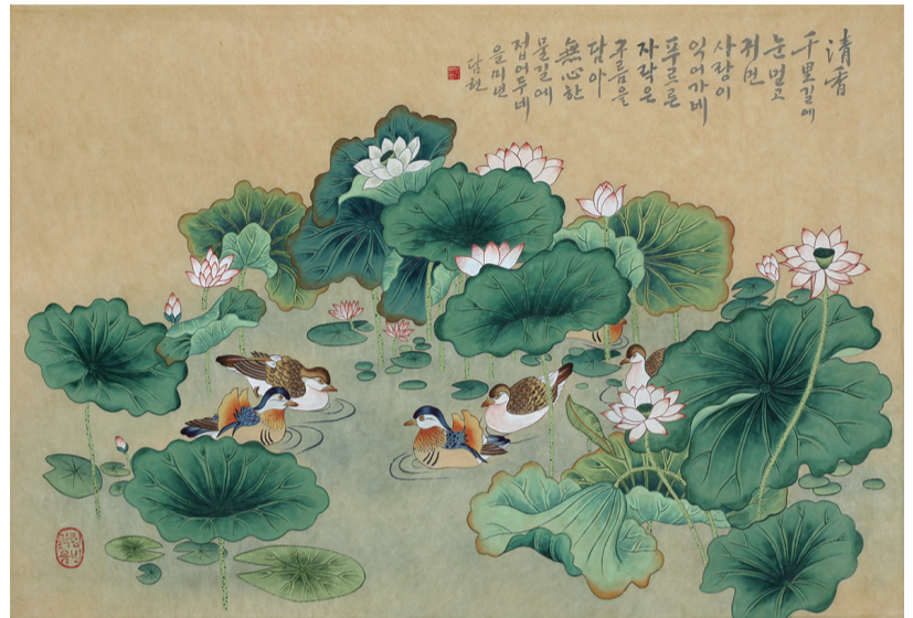
연그림 740 x 520mm

비 뿌린 한 여름 날씨 따라 몸과 마음이 물먹은 종이처럼 눅눅하고 축 처지는 느낌입니다. 경기 활성화에 부응하는 휴가도 잊어버리고 지내다 광복절 연휴 기분전환을 위해 연꽃으로 만발했을 양평 세미원(洗美苑)으로 향했습니다. “물을 보면서 마음을 씻고, 꽃을 보면서 마음을 아름답게 하라(觀水洗心 觀花美心)”는 의미를 살려 마음을 추슬러 몸을 가누고자 했습니다.